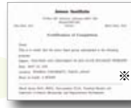
※修了証はイメージです。